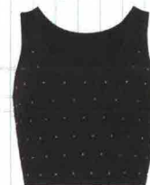
top con borchie €12,99